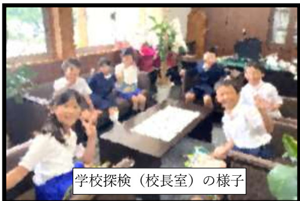
学校探検（校長室）の様子

2年生が1年生を案内して学校探検をしました。2年生は下広川小学校の1年先輩として学校の説明をしながら、いろいろなところを案内してくれました。とても、微笑ましい風景でしたので、校長室で写真を撮りました。みんなとてもいい顔でした。