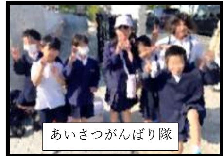
あいさつがんばり隊