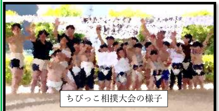
ちびっこ相撲大会の様子

八女相撲連盟による第46回ちびっこ相撲大会が竜光寺公園にて開催されました。主催者からなんとか子供たちを集めて欲しいという願いがあったので、声かけをして4、5年生8人で出場しました。結果はなんと団体戦、個人戦4、5年生の部で優勝しました。びっくりです。おめでとうございます。