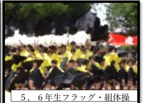
5, 6年生フラッグ・組体操