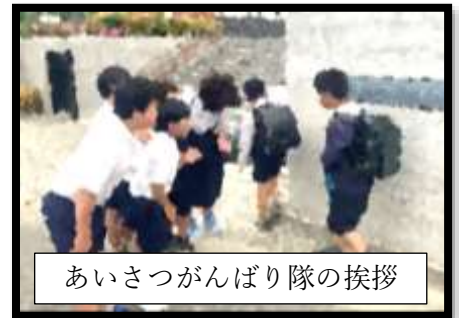
あいさつがんばり隊の挨拶