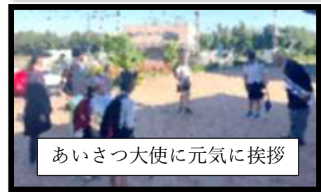
あいさつ大使に元気に挨拶